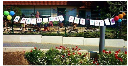
Bild: Abschlussfest der Schulanfänger 2021

Feste und Feiern gehören für uns als evangelische Einrichtung dazu und bilden den Rahmen für das Entdecken und Kennenlernen der Umwelt, des Lebens und der Gemeinschaft. Mit kirchlichen und jahreszeitlichen Festen und Feiern wird der Alltag in unserer Kindertageseinrichtung begleitet und gelangt zu Höhepunkten.